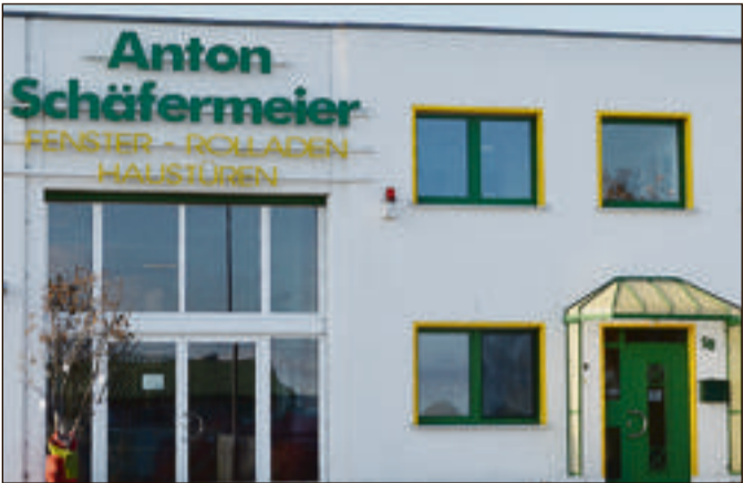
Handwerksbetriebe und global auftretende Unternehmen finden im Gewerbegebiet Am Wasserturm gleichermaßen ideale Entfaltungsmöglichkeiten.