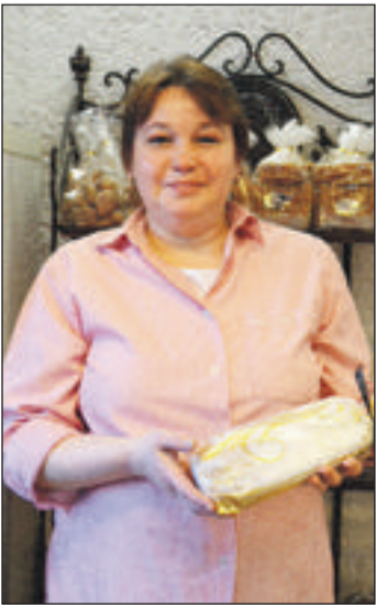
Gebäckspezialitäten versüßen die Weihnachtszeit.