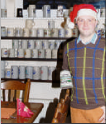
Vereine und Stammtische finden in Cappel die passenden Räume.