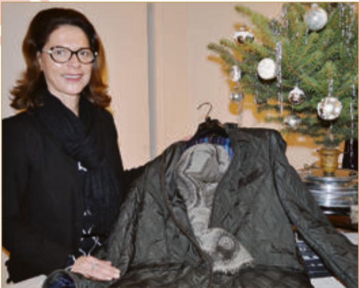
Herrenmode mit Stil und Klasse ist hier ebenso zu finden wie die hübsche Deko oder das auffallende Accessoire.