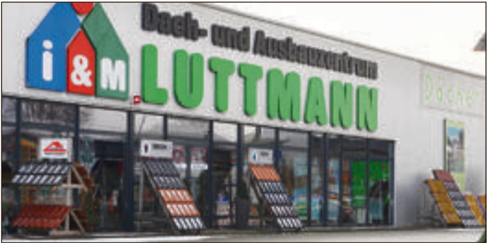
Enorm vielfältig sind die Angebote der Händler und Dienstleister, die sich im Schatten des Wasserturms erfolgreich angesiedelt haben.

unterschiedlichen Dienstleistern. Kennzeichnend für das größte Gewerbegebiet der Stadt ist ferner, dass insbesondere junge oder wachsende Firmen hier immer wieder ideale Expansionsmöglichkeiten gefunden haben und auch in Zukunft finden können.