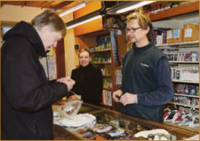
In unmittelbarer Nähe zum Lippstädter Weihnachtsmarkt werden die Kunden gerade jetzt in der Adventszeit in den überwiegend inhabergeführten Fachgeschäften willkommen heißen.