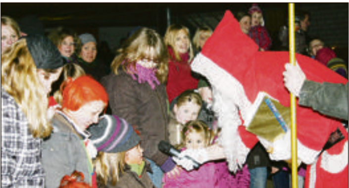
Natürlich wird auch der Nikolaus in der Reithalle des ZRFV Mastholte erwartet.

Kleinsten. Die Voltigiergruppe des ZRFV Mastholte zeigt wiederum auf eine ganz andere Art, wie man sich mit und auf dem Pferd mit viel Spaß bewegen kann. Natürlich hat auch der Nikolaus sein Kommen zugesagt und wird Geschenke für die Kinder verteilen. Außerhalb des Reitgeschehens werden Lotterielose verkauft. Und natürlich ist für das leibliche Wohl bestens gesorgt. Heiße und kalte Getränke und Speisen stehen bereit, um Zuschauer und Reiter zu stärken, ebenso wie die selbst gebackenen Weihnachtsplätzchen und Waffeln der Jugendlichen des Vereins.