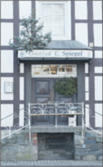
Gastronomische Highlights erwarten hungrige Gäste.