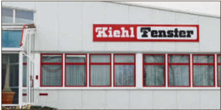
Für den Neubau oder die Hausmodernisierung empfehlen sich leistungsstarke Betriebe mit einer breiten Leistungspalette.