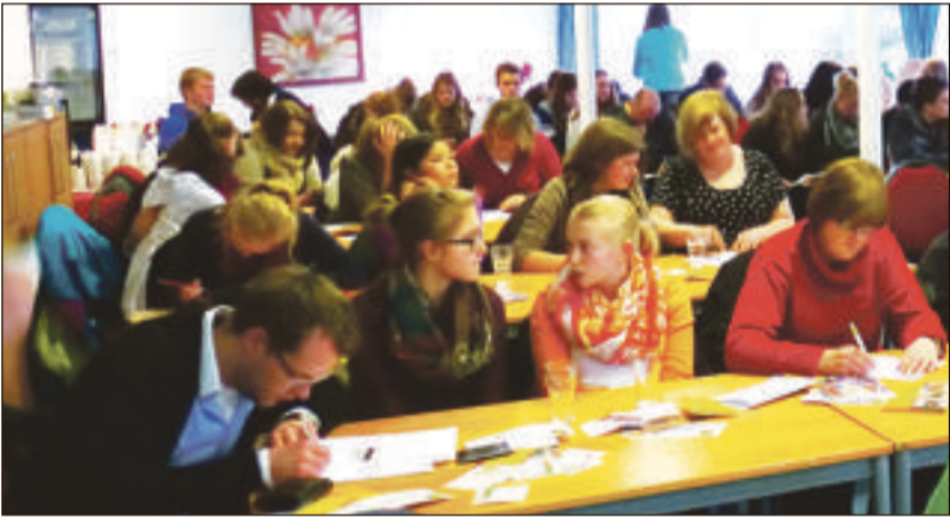
Vorstandswahlen und das Jahresprogramm beschafften die Delegierten der Kreismusikjugend.

Kreis Soest. Die Straßenverkehrsordnung sieht nach Angaben der Kreispolizeibehörde vor, dass Kraftfahrzeuge bei Glätte, Schneeglätte, Schneematsch, Eis- oder Reifglätte nur mit M + S-Reifen gefahren werden dürfen. Diese Reifen sind durch das M+S Symbol oder das Bergpiktogramm mit Schneeflocke (Alpine Symbol) gekennzeichnet. Ganzjahresreifen, die den Anforderungen entsprechen, sind mit dem M+S Symbol versehen. Grundsätzlich müssen alle Achsen der Kraftfahrzeuge mit solchen Reifen ausgerüstet sein. Kraftfahrzeuge zur Personenbeförderung mit mehr als acht Sitzplätzen außer dem Fahrersitz, sowie Fahrzeuge zur Güterbeförderung mit einer Gesamtmasse von mehr als 3,5 Tonnen müssen lediglich auf der Antriebsachse mit Winterreifen ausgerüstet sein. Wer mit seinem Auto bei Glätte, Schneeglätte, Schneematsch, Eis- oder Reifglätte ohne M+S Reifen angetroffen wird, bekommt eine Geldbuße von 40 Euro und einen Punkt in der Flensburger Kartei. Wenn ein Kraftfahrzeug bei den genannten Wetterverhältnissen den Verkehr behindert gibt es einen Punkt in Flensburg und es werden 80 Euro fällig. Wird ein anderer Verkehrsteilnehmer gefährdet, sind es 100 Euro und kommt es gar zu einem Verkehrsunfall, sind es 120 Euro und zusätzlich jeweils einen Punkt in Flensburg. Ob die Fahrzeugversicherer im Schadenfall ihre Versicherten in Regress nehmen können oder gar nicht zahlen, muss jeder Fahrzeughalter mit seiner Versicherung klären.