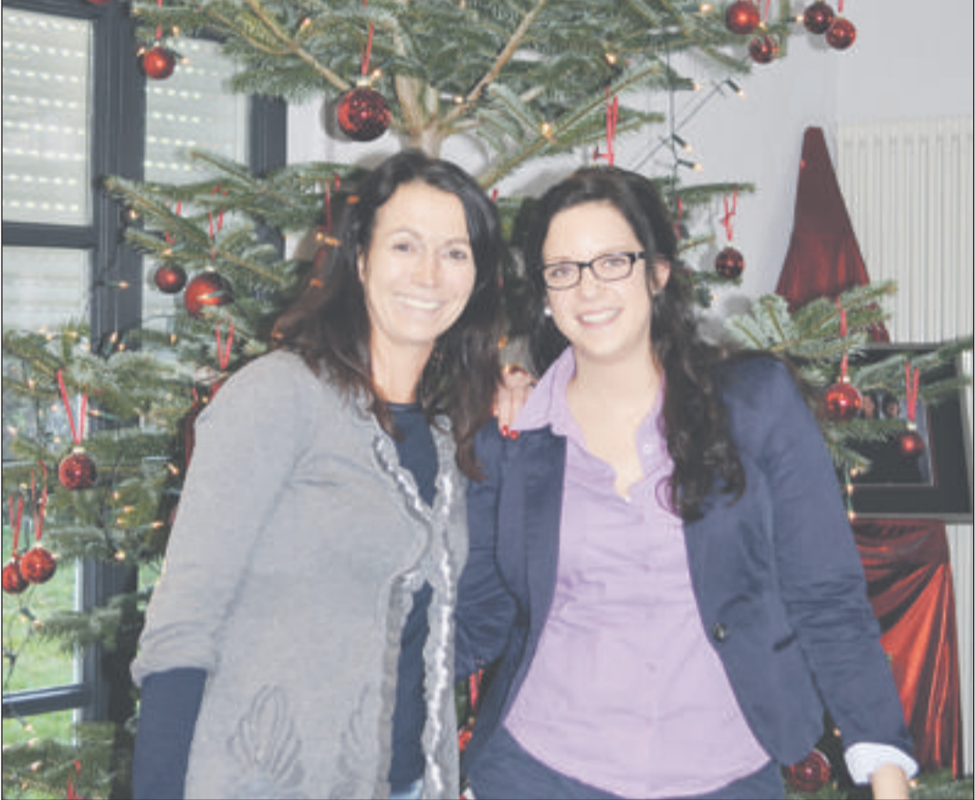
Weihnachten kann kommen – für das Styling an den Festtagen sorgen die Horner Beauty-Expertinnen.