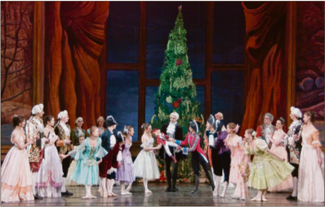
Das moldawische Nationalballett tanzt den romantischer Ballett-Klassiker mit der Musik von Peter I. Tschaikowsky im Stadttheater.

Prinz tanzen, beschenken dem Zuschauer großartige Ballettmomente. Das Moldawische Nationalballett steht für hohe tänzerische Qualität und Stilbewusstsein für das klassische Repertoire. Bewusst widmet es sich der Pflege der großen klassischen Ballette.