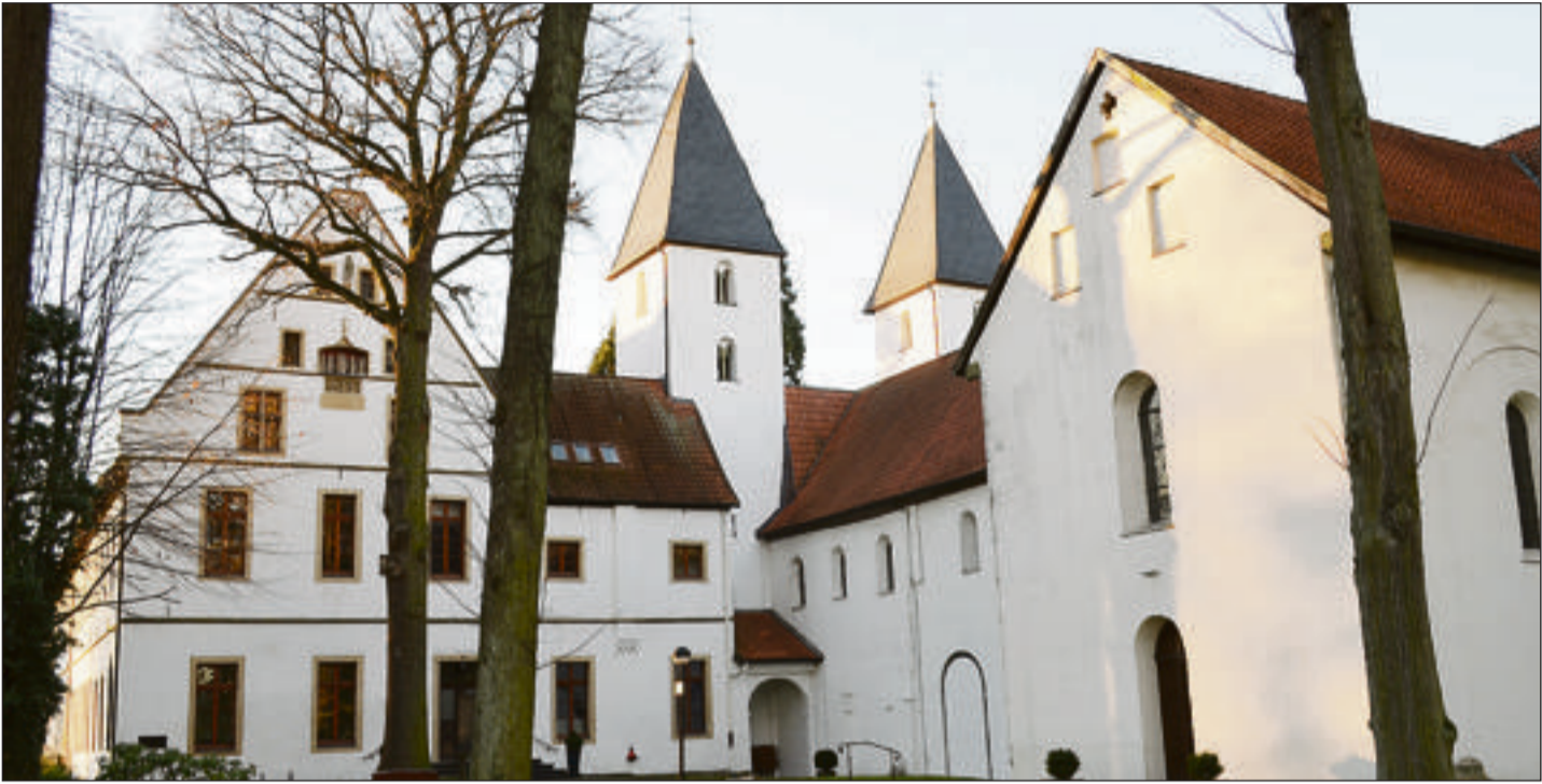
Mit der Stiftskirche hat Cappel eine echte Sehenswürdigkeit. Sie ist eine der ältesten dreischiffigen Pfeilerbasiliken in Westfalen. Als Baubeginn gilt das Jahr 1139. Die Stiftskirche wurde als Klosterkirche eines Prämonstratenserinnenklosters erbaut und gehörte später zum freiweltlichen Damenstift Cappel.