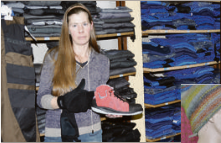
Arbeits- und Schützenbekleidung in großer Auswahl bietet dieses Fachgeschäft.

Wochen vor dem Fest besticht die Straße nicht nur durch ihren herausragenden Einzelhandelsbesatz, sondern die hinreißende Straßenbeleuchtung. Engagierte Geschäftsleute setzen hier gekonnt eigene Akzente und unterstützen damit die Feststimmung in der ganzen Stadt.