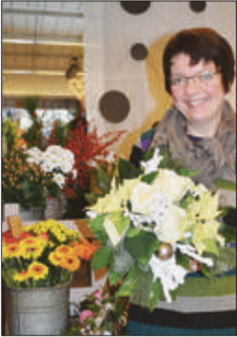
Mit Liebe zusammengestellt wurden diese schöne Dekorationen fürs Fest.