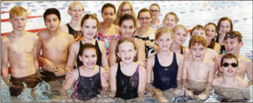
Beim Adventsschwimmfest in Arnsberg waren jetzt 21 Schwimmer von Teutonia Lippstadt am Start.

Berlin Als die Bundesliga im August, ihre 51. Auflage startete, waren Berlin und Braunschweig die Aufsteiger. Doch damit hören auch schon die Gemeinsamkeiten auf. Insbesondere der Vergleich am drittletzten Spieltag der Hinrunde zeigte die Unterschiede auf. Mit 2:0 setzten sich die Hauptstadtler klar bei den Niedersachsen durch. Während Hertha mit 22 Punkten den siebten Rang einnimmt, bildet die Eintracht mit acht Zählern abgeschlagen das Schlusslicht.