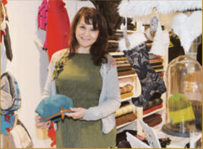
Die Geschäftsleute halten eine große Auswahl an Geschenkideen bereit, und das Sortiment ist breit gefächert.