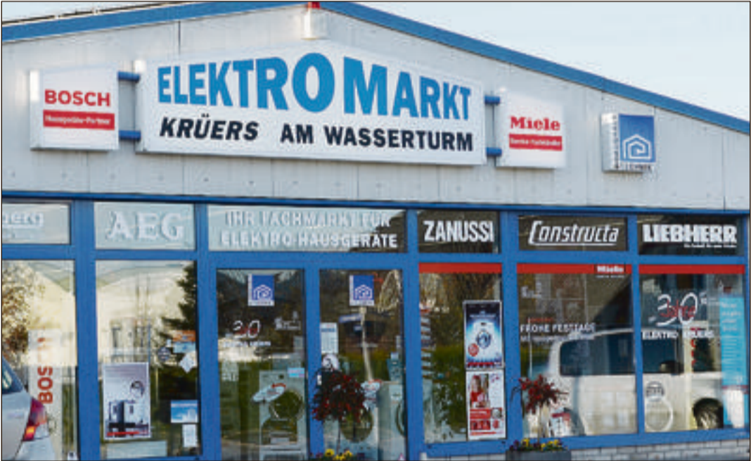
Vom international auftretenden Unternehmen bis zum Würstchengrill um die Ecke reicht die Bandbreite der hier agierenden Unternehmen und Dienstleistungsbetriebe.

Lippstadt. Im Gewerbegebiet am Wasserturm, dem größten Gewerbegebiet im Stadtgebiet lassen sich während des gesamten Jahres praktische, schöne, leckere und nützliche Dinge finden, aber speziell in der Vorweihnachtszeit legen die hier ansässigen Händler und Dienstleister noch eins drauf und bieten viele Angebote, die insbesondere zu Weihnachten eine besondere Freude machen. Charakteristisch ist der immens breite Branchenmix, der im Schatten des Wasserturmes anzutreffen ist. Die Erfolgsgeschichte des Gewerbegebietes findet auch in Zukunft eine stetige Fortsetzung, weiterhin wird hier kräftig investiert sowie gebaut und es soll noch mehr werden. Die eindrucksvolle Entwicklung des Areals begann 1980 mit anfänglich 20 Unternehmen. Gegenwärtig sind es weit mehr als 150 Unternehmen aus den Bereichen Gewerbe, Handel, Handwerk und Dienstleistungen, die auf dem mittlerweile nahezu 200 Hektar großen Areal im Süden Lippstadts einen attraktiven Standort und erstklassige Entfaltungsmöglichkeiten gefunden haben. Die erstaunliche Fülle der Angebote reicht von Autozubehör, Blumen, Neu- und Gebrauchtfahrzeuge, über Heimwerkerbedarf,