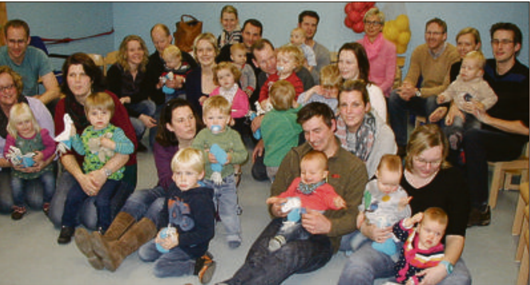
Für die Kleinsten im Eickelborner Kindergarten St. Josef war beim ersten „Taufkaffee“ Spielen und gegenseitiges Kennenlernen angesagt.

lichkeit, den Kindergarten selbst näher kennenzulernen und erfuh-