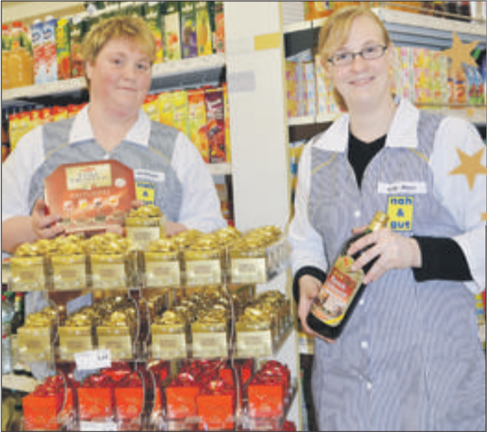
Lebens- und Genussmittel und alles für den täglichen Bedarf finden die Verbraucher mitten im Herzen von Horn.