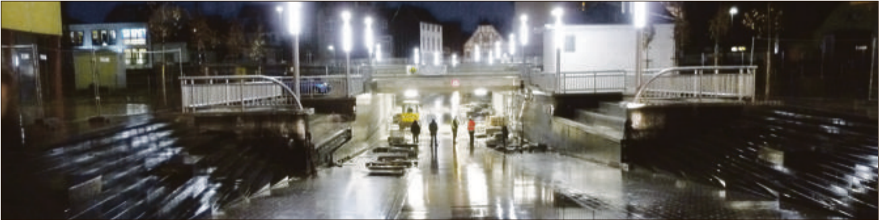
Probeweise gingen schon mal die Lichter an. In der kommenden Woche stellt die Stadt auf Regelbetrieb um gibt die Unterführung für Fußgänger, Radfahrer und den ÖPNV frei.

Kein Wunder, dass es auch bei diesem Großprojekt mit technisch anspruchsvollen Aufgaben kritische Momente gab. Hermens nennt drei davon: den Einschub der Bahnbrücke, die Gründungsarbeiten auf der Nordseite mit Sicherstellung der vorhandenen Bebauung und das Thema Archäologie. Für die umliegende und angrenzende Geschäftswelt bedeutet das Projekt viele Monate Einbußen und Einschränkungen. Der Stadtspitze ist das sehr bewusst. „Für die Beein-