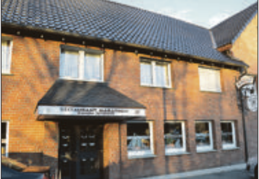
Auch Gastronomisch können sich Genießer verwöhnen lassen. Für jeden Geschmack gibt es das Passende.